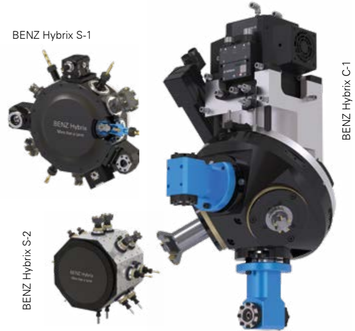
BENZ Hybrix C-1