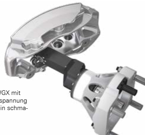
Winkelkopf Slim WGX mit direkter Werkzeugspannung für Bearbeitungen in schmaler Störkontur