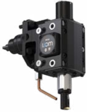
Stoßeinheit BENZ LinA 4.0