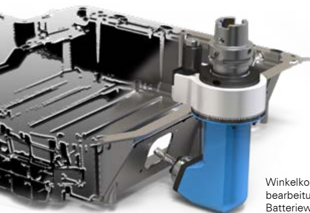
Winkelkopf für Fräsbearbeitung an einer Batteriewanne für Elektrofahrzeuge