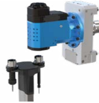
Winkelköpfe zum automatischen Ein- und Auswechseln der Front-Werkzeuge

In der Fertigung sind oftmals verschiedene Werkzeuge im Einsatz. Mit Winkelköpfen zum automatischen Ein- und Auswechseln der Front-Werkzeuge lassen sich unterschiedliche Prozessvarianten wirtschaftlich abbilden.